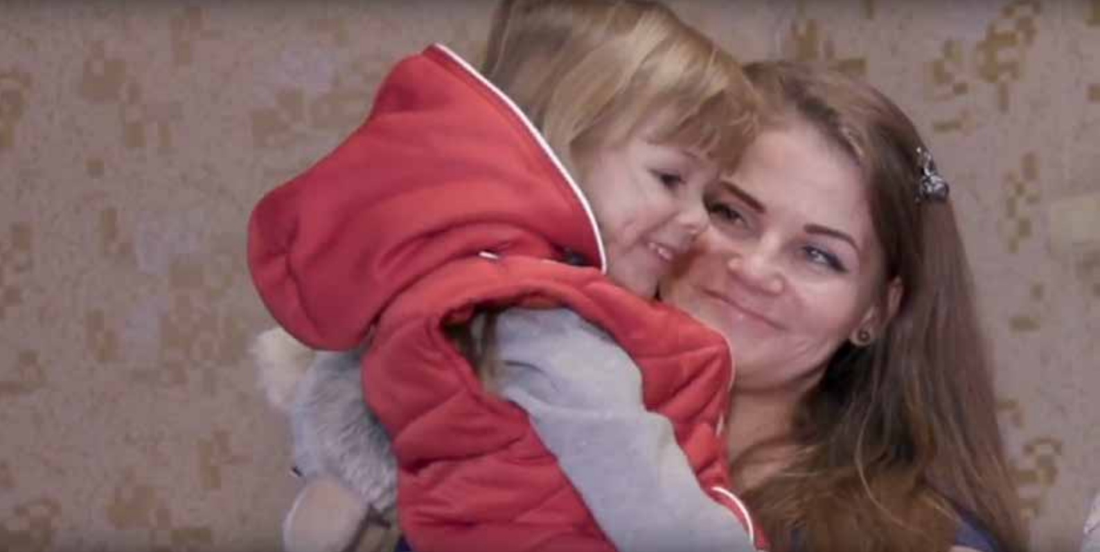
Julia med sin dotter