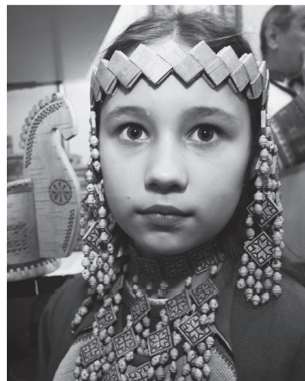
En mordvinsk flicka

Översättningsteamet arbetar med Gamla Testamentets texter. Ordspåksboken, Jona och Ester är redan översatta. De behöver dina förböner!